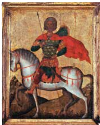
Heiliger Menas von Ägypten auf dem Pferd, Kreta, um 1500

Erkunden Sie die faszinierende Geschichte der Ikonenmalerei und der Kleinkunst im christlichen Osten: über 3.000 Ikonen, Stickereien, Miniaturen sowie