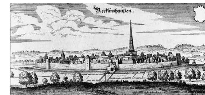
Stadtansicht von Osten, Kupferstich, 1647

Erfahren Sie etwas über die ereignisreiche Vergangenheit des Vestes Recklinghausen und entdecken Sie einzigartige Schätze wie zum Beispiel die Stadtgründungsurkunde für Recklinghausen von 1236.