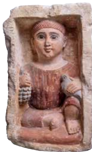
Nischenfigur eines hockenden Knaben, Ägypten, Ende 3. Jahrhundert

Erfahren Sie mehr über die koptische Kunst Ägyptens – von der heidnischen Spätantike bis ins frühe Mittelalter. Einzigartige Ausstellungsstücke wie Mumienporträts,