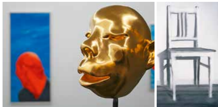
Ausstellung „Facing China“

Öffnungszeiten: Di - So und feiertags von 11 bis 18 Uhr - Heiligabend und Silvester von 11 bis 14 Uhr Öffentliche Führungen: sonntags 11 Uhr Eintritt: 5 €; ermäßigt: 2,50 €