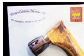
Stempel mit Brief