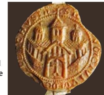
Das Siegel der Stadt aus dem Jahr 1253

Mit seinen Jahrhunderte alten Dokumenten zählt das Stadtarchiv zu den wertvollsten und größten Westfalens. Zahlreiche mittelalterliche Urkunden, Fotos, Akten, Artefakte und vieles mehr erwarten Sie.