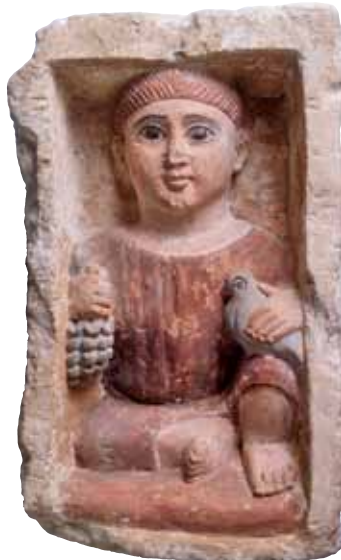
Figura siedzącego chłopca w niszy, Egipt, koniec 3-go wieku

Wyjątkowe eksponaty, jak portrety mumii, krzyże, płaskorzeźby, materiały, szkła i