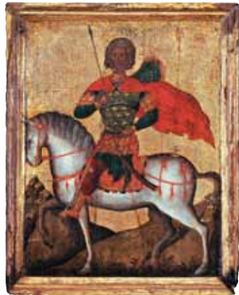
Św. Menas z Egiptu na koniu, Kreta ok. 1500 roku

Poznajcie fascynującą historię malowania ikon oraz drobną sztukę chrześcijańskiego Wschodu: ponad 3000 ikon, haftów, miniatur oraz prac w drewnie i metalu pochodzą-