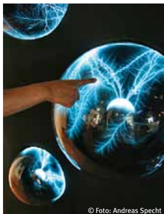
Największy w Europie plazma ball

Godziny otwarcia: Wtorek - niedziela 10-17 zegar, Od czerwca do sierpnia, a Pon 10 do 17 zegar Bezpłatne przypomnienie: 1 Niedziela miesiąca 15 zegar