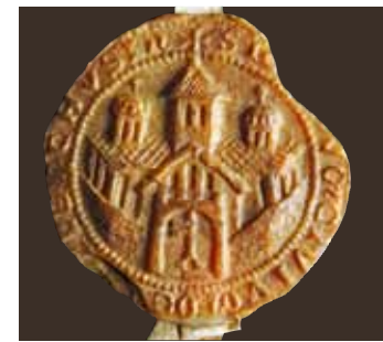
Pieczęć miasta z 1253 roku

Oczekują na Was liczne średniowieczne akty, dokumenty, zdjęcia, eksponaty i dużo więcej. Powstanie miasta, historia górnictwa czy historia migracji: poszperajcie w pełnej wydźwignięt przeszłości Recklinghaus-