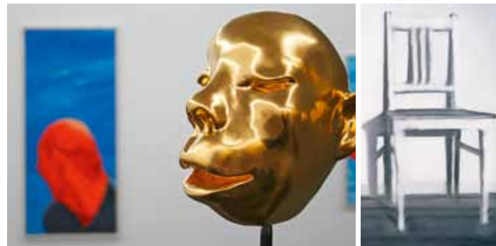
Wystawa „Facing China“

Godziny otwarcia wt. – nd. i święta od 11 do 18 zegar oprowadzanie z przewodnikiem w niedzielę o 11.00