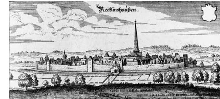
Widok na miasto od wschodu ok. 1634 roku, miedzioryt, 1647 roku.

sen i odkrycie wyjątkowe skarby, jak np. akt założenia klasztoru Flaesheim z 1166 roku. Instytut prezentuje historię miasta i regionu w nowoczesnej atmosferze.