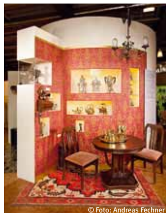
Widok z zelektryfikowanych gospodarstw domowych w 1910 r.

Ta niezwykła kombinacja przemysłowego pomnika i muzeum sprawia, że energii